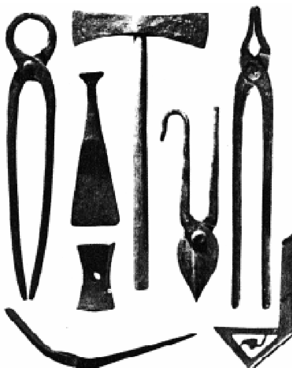
Utensilios más usuales en la construcción

A mediados del siglo III comienza una larga serie de crisis que azotarán al Imperio Romano hasta su desaparición a finales del siglo V.