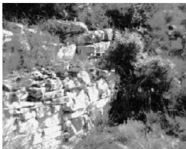
Poblado ibérico de la Vall de Batea