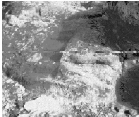
Poblat ibèric del Pontet